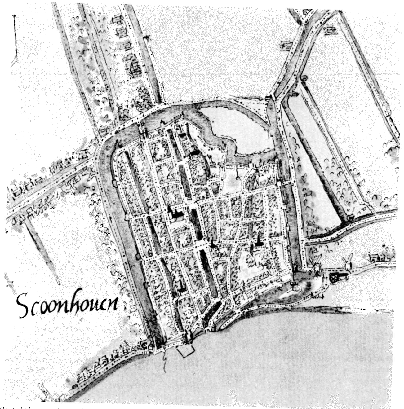
De stadsplattegrond van Schoonhoven door Jacob van Deventer (1560). Het oude kasteelterrein bevond zich in de noordoosthoek van de stad, in de zuidoosthoek werd door Rombout Keldermans het nieuwe kasteel ontworpen. Op deze plek is de toren "Nieuw Slijkenborch" zichtbaar.

De eerste activiteiten betreffen het onderzoeken van de bodem door middel van grondboringen: “betaelt jan wairt temmerman van vier daghen dat hij met zijnen instrumenten gewrocht heeft in de voirscreven weke omme te helpen boren den grondt van den fundamenten daer men den eersten torre van den voernoemde casteele setten zoude ende te weten wat grondt dat men daer vinden zoude”.