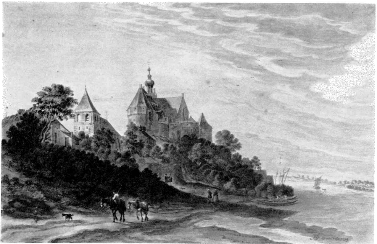
Het kasteel Kessel vanuit het zuidwesten naar een tekening van Jan de Beijer. (Part. coll.)