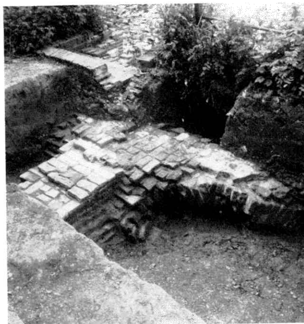
Opgraving 1968. Ontmoetingspunt van het westelijk deel van de ommuring bleekveld met de zuidwesthoek van de middeleeuwse woontoren. Hier tekent zich eveneens de driehoekige overkluizing af.

De afbeeldingen uit het begin van de 17de eeuw – Hessel Gerrits, Buchelius – geven nauwelijks enige informatie over de bouwkundige situatie van wat er daar architectonisch aan de hand is. Dat wil zeggen, hoe het er dan uitziet. De ontwikkeling blijft volstrekt onduidelijk. Er