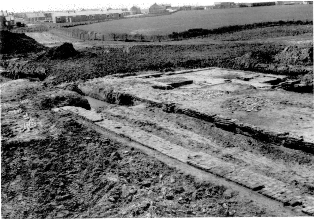
Afb. 3. Overzicht van de stoeterij; opgraving 1967. Op de achtergrond het verblijf van de maarschalk (verzorger van de paarden). In het midden van het gebouw resten van het plaveisel.

De gespecificeerde rekening maak het mogelijk het aantal aanwezige paarden in St. Maartensdijk in de periode januari 1457 tot 25 januari 1458 te berekenen. Per week zijn het er 10 en soms 13. De eerder genoemde Jan van Bergen heeft hierover het toezicht.