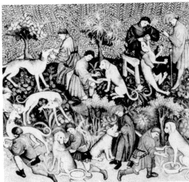
Afb. 4. Verzorging van zieke honden. Uit het jachtboek van Gaston Phoebus. Bibliothèque Nationale, Parijs.