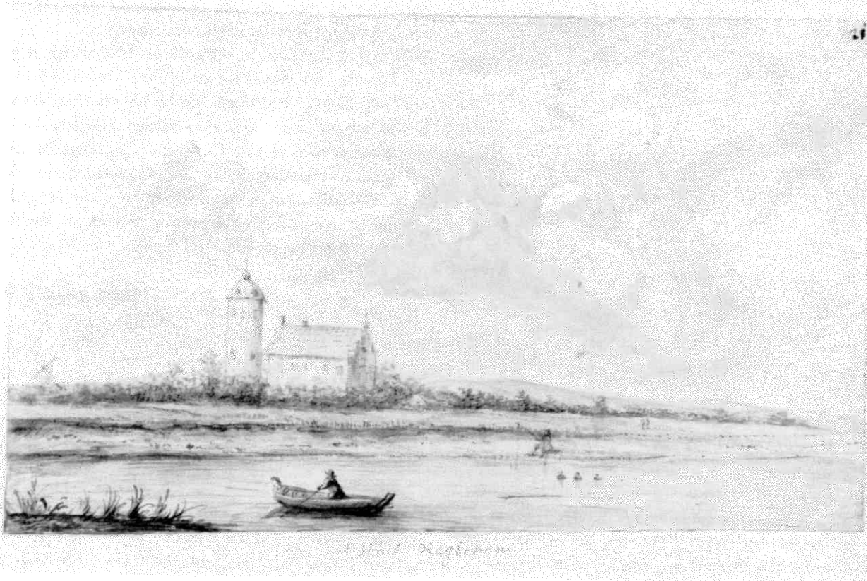
Afb. 3. Oudst bekende afbeelding van Rechteren; aquarel van Gerrit Grasdorp, dat. van rond 1680. (Provinciaal Overijssels Museum, Zwolle)

dach in Mayo gewonnen twee steenmesselers myt eenen opperknecht, soe dat huys grote vensteren hadde, deselve laten tomaecken. De rynckmueren mytten kelder lach ale open , dat to samen laten stoppen, so men best mocht. 13 Met deze kelder bedoelde men wellicht de brugkelder ter plaatse van de verbinding van het hoofdgebouw met het voorterrein, dat ongetwijfeld door een gracht van dat hoofdgebouw was gescheiden.