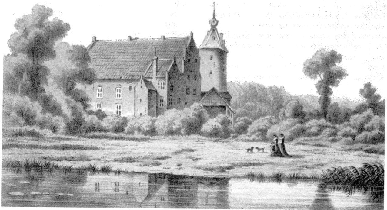
Afb. 5. Kasteel Rechteren; oosthoek. Naar een steendruk uit de 19de eeuw.