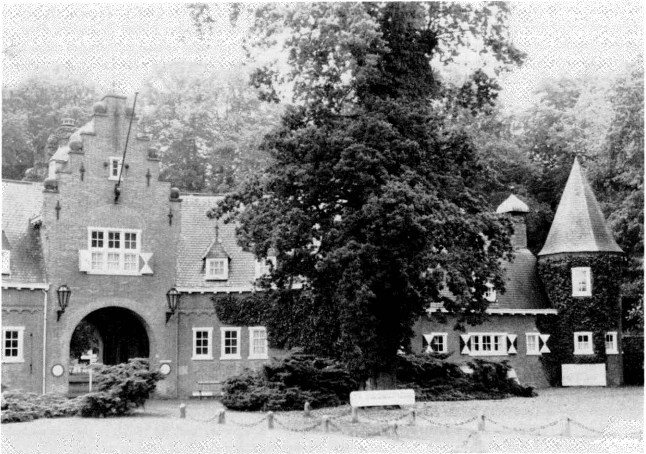
Poortgebouw van Huis Doorn, waar de zetel van de N.K.S. gevestigd is.