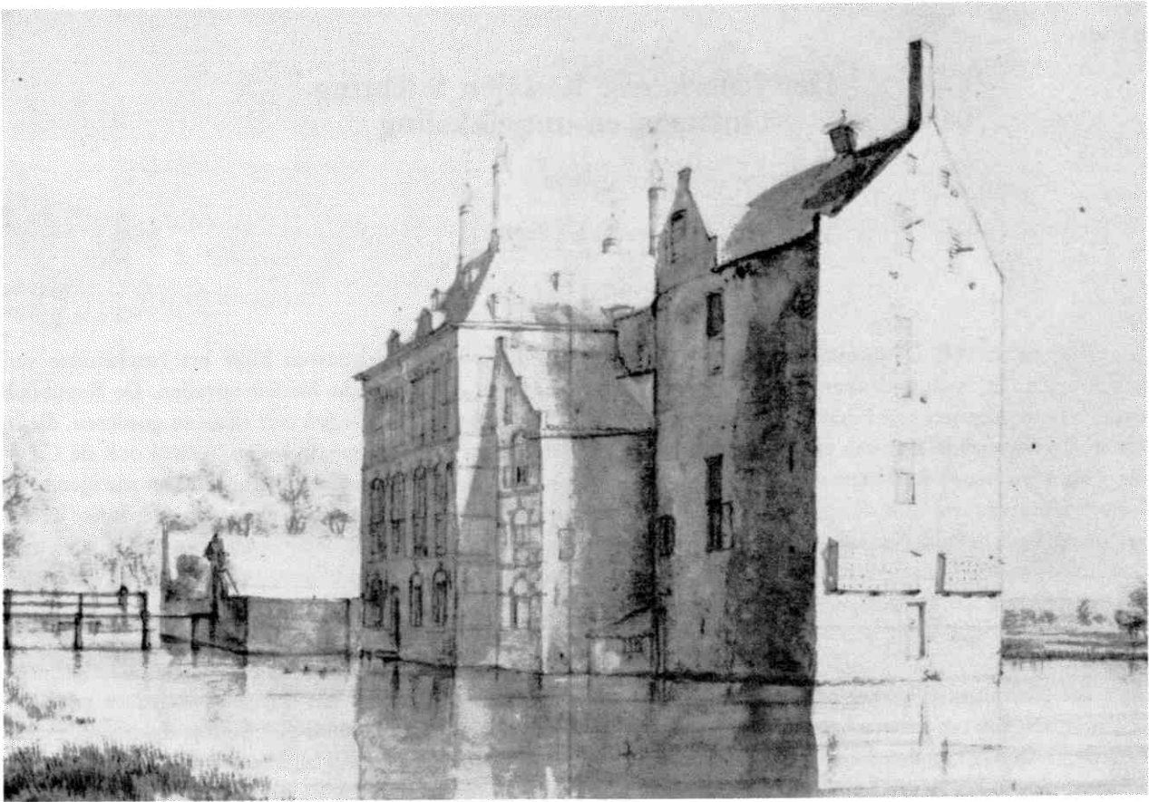
Huis Dever rond 1640 naar een tekening van Roeland Roghman. Sinds het midden van de 19e eeuw een ruïne. Huis Dever onder Lisse behoorde tot de kastelen, die na de Tweede Wereldoorlog onder het beheersinstituut vielen.

rische Huizen-bestand, terwijl de ± 200 andere kastelen en huizen nog in particuliere handen zijn of ondergebracht in stichtingen tot instandhouding van het oude familiebezit.