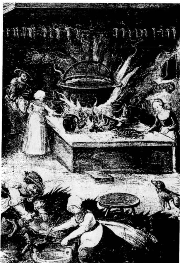
Afb. 1 Laat-middeleeuwse keuken naar een schilderij van Hans Wertinger. Men lette op de enorme pan boven het vuur.

100 geboden (gevorderde) wagen tot Breda, voir den cost, van elcen wagen 3 groten facit 25 schellingen. Facit t samen en Florys voirscreven van desen hout betaelt is 7 £ 20 denier groot, gelijc zijn cele inhoud ende men hier overlevert. Item Evert Heinrix betaelt van dit vorsch. hout te brengen mit enen coggescepe van Breda in den Bryel ende in St Mertensdyck, van elk 1000 12 groten facit 25 sc. g. Ende van dezen houts is geleverd in den Bryel 9500 en het andere is geleverd in St. Mertensdyck. Item van desen 9500 houts van op doen in den Bryel van elc 1000 10 groten facit 7 sc. 11 g. facit t samen 8 £ 14 sc. 7 g. Hier of gaet een dusent houts ende die rentemeester in zijn huys opgedaen heeft cost t samen meten oncoste 6 sc. 9 g. Die afgetogen so blijft t voirscreven hout 8 £ 7 sc. 10 g.' 4