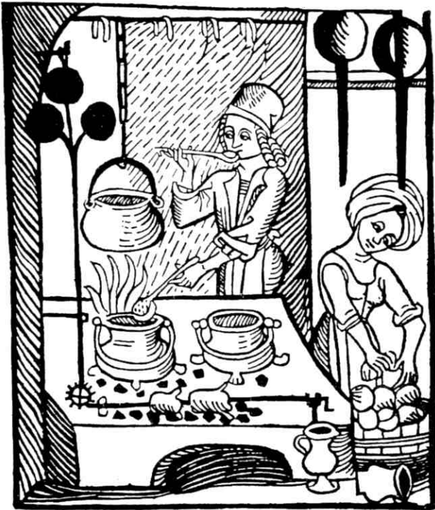
Afb. 2 Keukenpersoneel aan het werk. Naar een oude houtsnede.