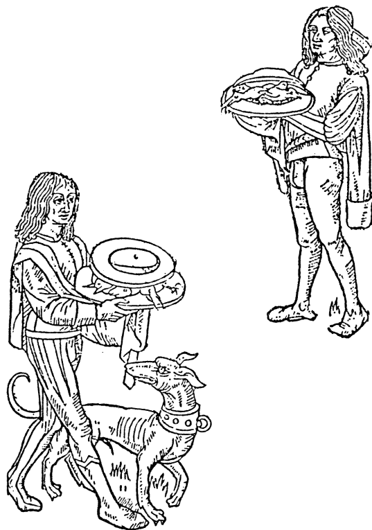
Afb. 3 Twee dienaren, die spijzen opdragen.

De gebruiksvoorwerpen in de keuken en bij de maaltijden zijn gemaakt van metaal, hout of aardewerk. Waar en hoe koopt men ze en wat zijn de kosten? Onder metaal valt te verstaan ijzer, koper, tin en zilver.