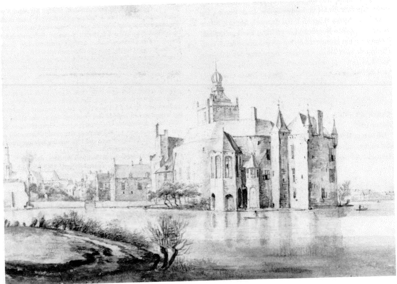
Afb. 1 Gezicht op kasteel Montfoort uit het zuidwesten (autotypie naar een tekening van Roeland Roghman uit 1647). Uiterst rechts de in de slotgracht uitstekende vierkante toren die in de opgraving 1981 bij C is aangesneden.

Plannen voor de herinrichting van het terrein van kasteel Montfoort in het centrum van de gelijknamige stad hebben in 1981 geleid tot een nadere archeologische verkenning van dit door de Monumentenwet beschermde archeologische monument. Het kortdurende onderzoek (21 april tot 12 mei) werd uitgevoerd door de Rijksdienst voor het Oudheidkundig Bodemonderzoek en stond onder leiding van de auteur. Aan het doel om meer gegevens te verzamelen, zodat de archeologische overblijfselen in de ondergrond bij de herinrichting zoveel mogelijk ontzien konden worden, werd voldaan. Ook aan de oplossing van enkele van de vele wetenschappelijke vragen die nog steeds rond dit kasteel bestaan heeft het onder-