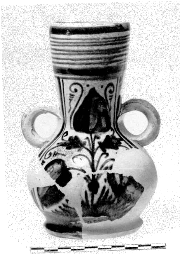
Afb. 3 Kannetje met polychroom bloemmotief op een wit fond van Italiaanse majolica uit het eind van de 15e eeuw. De scherven werden met veel ander materiaal verzameld uit de vulling van de gracht tussen hoofd- en voorburcht bij B..

spec. p. 143-147). Over de bouwgeschiedenis is weinig bekend. Na desastreuze vernielingen in 1672 is het kasteel op enige restanten op de voorburcht na gesloopt. Het kasteelterrein is echter als topografische eenheid, waarin begrepen hoofdburcht + voorburcht met de ringgracht, blijven bestaan. Deze landschappelijke eenheid is pas verstoord door de aanleg van de moderne Provinciale Weg, die het terrein in twee delen heeft gesneden. In het noordelijke (= grootste) deel bevindt zich de totale voorburcht met de enige overgebleven opstallen van het kasteel. Tussen 1977 en 1979 zijn hier verkenningen uitgevoerd door J.G.N. Renaud in samenwerking met de NJBG, waarbij het beloop van de schildmuur van de voorburcht grotendeels is vastgesteld; alleen de westelijke afsluiting is nog onzeker (zie J.-E. Diltz in Jaarverslag van de Nederlandse Kastelenstichting 1977, p. 53-55; 1978, p. 39-41; 1979, p. 23-25). Bij de nieuwe verkenning uit 1981 (afb. 2) is in de zuidoostelijke hoek van deze schildmuur een vierkante fundering geconstateerd, die mogelijk van een hoektoren afkomstig is (A). Mogelijk, omdat de fundering hiervoor eigenlijk wat licht van constructie bleek te zijn. Tevens kon in deze hoek de verbinding van de zuid- met de oostmuur van de voorburcht vastgesteld worden.