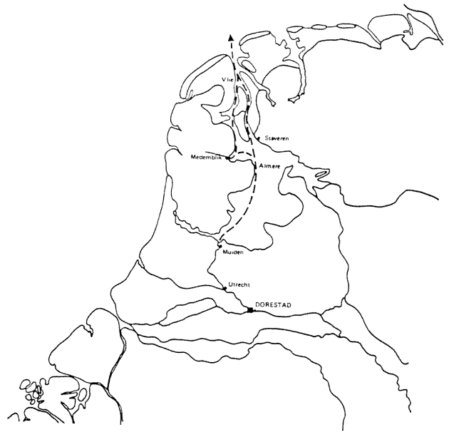
De handelsroute Dorestad-Friesland via Kromme Rijn, Vecht, Almere in de vroege middeleeuwen.

De tijdelijke afscheiding van de rest van Holland was ook de oorzaak dat men in Hoorn een Munt oprichtte, omdat het onmogelijk was geworden om geld uit 's lands Munt in Dordrecht te krijgen. Toen na enkele jaren de militaire situatie was veranderd probeerden de Staten de Munt op te heffen. De Gecommitteerde Raden richtten in 1586 echter een nieuwe Munt op die beurtelings in Hoorn, Enkhuizen en Medemblik gevestigd zou zijn. Dit doorzetten tegen de wil van de Staten is een typisch voorbeeld hoe onafhankelijk het gewest zich voelde. Het besluit dat de Munt om de drie jaar in de drie Westfriesse steden zou zetelen heeft overigens tot allerlei geharrewar aanleiding gegeven. Pas in 1658 kwam Medemblik voor het eerst aan de beurt. Later werd de Munt niet meer om de drie jaar, maar om de tien jaar verplaatst. De Westfriesse Munt heeft tot eind 1806 bestaan; per 1-1-1807 zijn alle provinciale munthuizen opgeheven. Straat- en pandna-