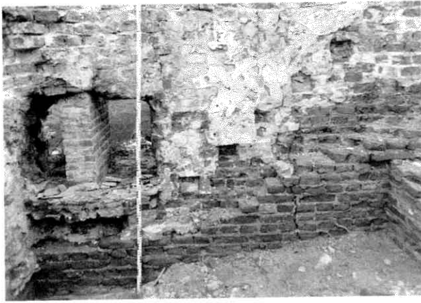
Afb. 4. De kelder nabij de westtoren (6 a); duidelijk zichtbaar zijn de afdrukken van de traptreden aan de binnenzijde van de ringmuur.

lijk overheen werd gebouwd. Het overige muurwerk zal behoord hebben tot een lange smalle (dienst)vleugel (afb. 3), gelegen tussen het gebouw met de Gelderse gevel en de westvleugel. Mogelijk stond dit dienstgebouwtje eerst (in de zestiende eeuw) los tegen de toen nog niet afgehakte weergang op bogen (afb. 1.20). Toen de weergang eenmaal was afgebroken (ook in 1686?) zal de binnenruimte zijn doorgetrokken tegen de ringmuur, waarin toen tevens de drie vensters zullen zijn aangebracht. Van de vloeren zijn op diverse plaatsen nog restanten aanwezig, overigens daterend uit verschillende perioden en deels bestaand uit baksteen op z'n plat, deels uit plavuizen.