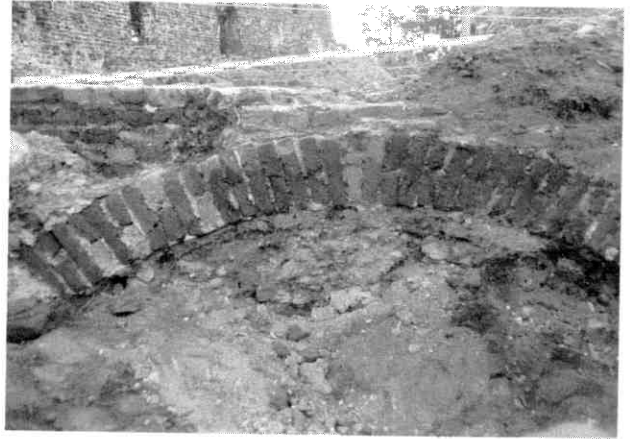
Afb. 2. De grondboog in de zuidvleugel.

Deze opening is, waarschijnlijk in de zestiende eeuw, in zijn geheel opgevuld met mergelblokken. Omdat een direct verband met de tweede bouwperiode van de ringmuur niet is aangetoond, zou het kunnen zijn dat de opening nog enige tijd na de herbouw als doorgang heeft gefunctioneerd. De oorspronkelijke functie van de doorgang is evenmin duidelijk. Het veertiende-eeuwse buitenoppervlak is verdwenen, mogelijk bevond zich daarin een poortje waardoor men op het talud van de gracht kon komen. De achterzijde van de doorgang kan afgesloten zijn geweest met een dun tussenmuurtje of een houten schotwerk binnen de dikte van de ringmuur, dit teneinde de grond van het binnenterrein tegen te houden. In de aldus verkregen koker zou men met een ladder hebben moeten af-