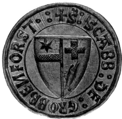
9. Zegel van de schepbank Grubbenvorst.

HSAD = Hauptstaatsarchiv Düsseldorf RAL = Rijksarchief in Limburg RAG = Rijksarchief in Gelderland RAO = Rijksarchief in Overijssel