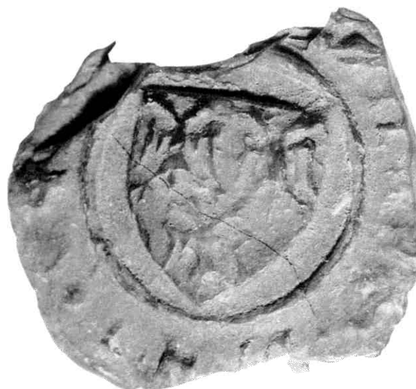
4. Willem Brant van Brede, 1391 juni 2 Randschrift: onleesbaar Diameter : circa 22 mm Schild beladen met drie (2:1) dubbelkoppige adelaars.