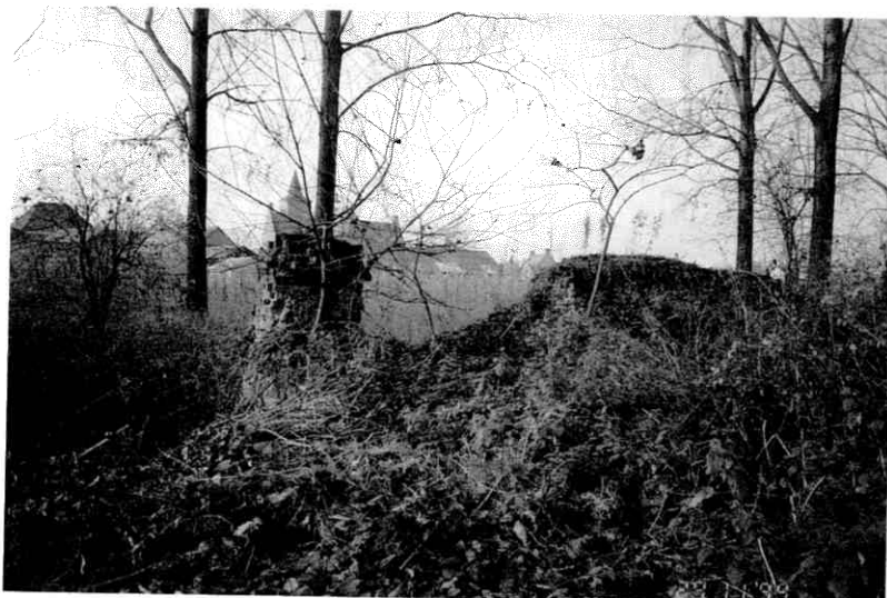
Afb. 2. De restanten van Blitterswijk.