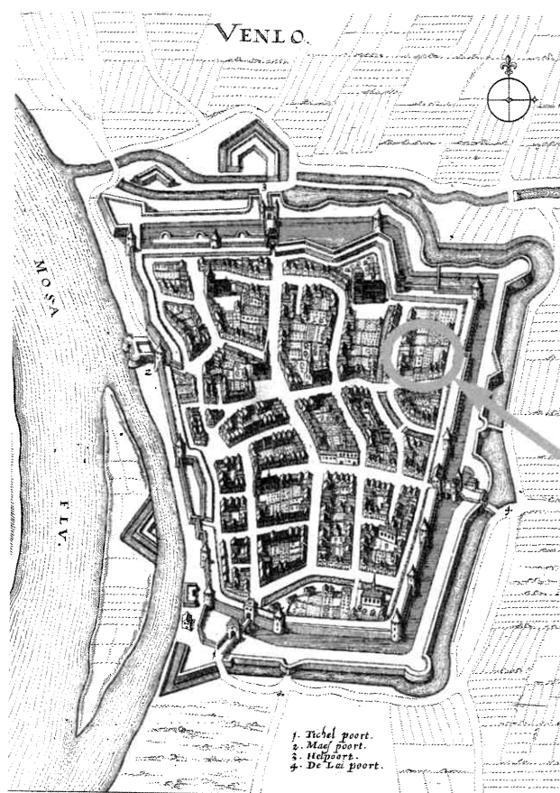
Venlo, volgens Matbias Merian de Oudere. GA Venlo, Verzameling kaarten en prenten, inv.nr. 493.

Op de vraag of de hertogenhof een stadskasteel was, moeten we het antwoord zoeken bij de resultaten van het archeologisch onderzoek. De funderingen van het opgegraven gebouw hadden niet die spectaculaire omvang van de kastelen uit de 14e eeuw. Bovendien was de verdedigbaarheid van de hof, omgeven door een stadswal, slechts van indirect belang. De wallen waren tijdens de Bourgondische aanvallen in 1511 ernstig beschadigd, maar of dat toen ook met de hertogenhof gebeurd is weten we niet. De ligging van de