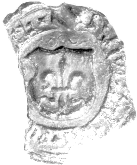
Afb. 3. Sybert van Eyll, 20 april 1520. diameter ± 26 mm. Randschrift: + S' rest onleesbaar. Wapenschild met een Franse lelie. Bron: RAL, Familiearchief Scheres-d'Olne, inv.nr. 709.

familienaam Van Baerle komt in de 14de eeuw regelmatig voor, terwijl het om verschillende geslachten gaat. Dit blijkt ondermeer uit het feit dat zij verschillende familiewapens voerden. In eerste instantie hebben we te maken met twee neven, die beiden toevallig Willem heetten. Eén van hen erfde van zijn vader bezittingen in Well. De andere Willem komt slechts een beperkt aantal keren in de geschreven stukken voor. Op 6 juli 1320 verkocht Arnold, voogd van Straelen, aan Zeger van Baerle al zijn rechten en goederen in de parochies Well en Bergen 2 . Reeds vóór 5 december 1340 vererfden Zegers bezittingen op zijn zoon Willem van Baerle. Op 5 december 1340 maakte deze Willem met z'n zus Elisabeth een erfdeling, waarbij Elisabeth alle rechten van de 'teynde van Elslaer gelegen bennen Welre' kreeg toegewezen 3 . De akte werd zowel door haar broer Willem als ook door hun neef, eveneens Willem van Baerle geheten, bezegeld. De