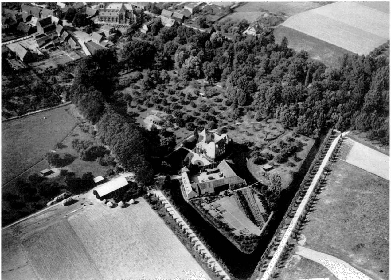
Afb. 7. Luchtfoto omstreeks 1930.