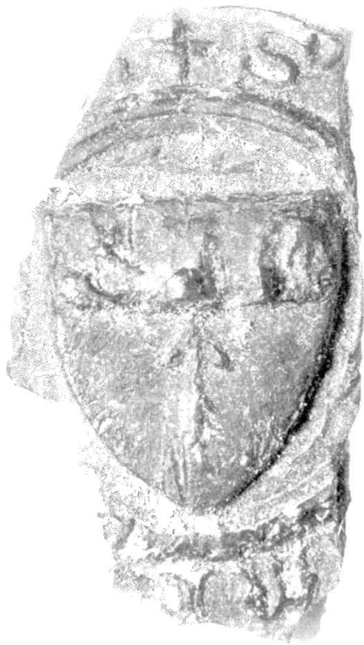
Afb. 4. Willem van Baerle, 5 december 1340 diameter ± 24 mm. Randschrift: + S' .... rest verloren ... Schildhoofd: een klimmende leeuw. Onder een recht opstaande pijl (Well-Straelen).