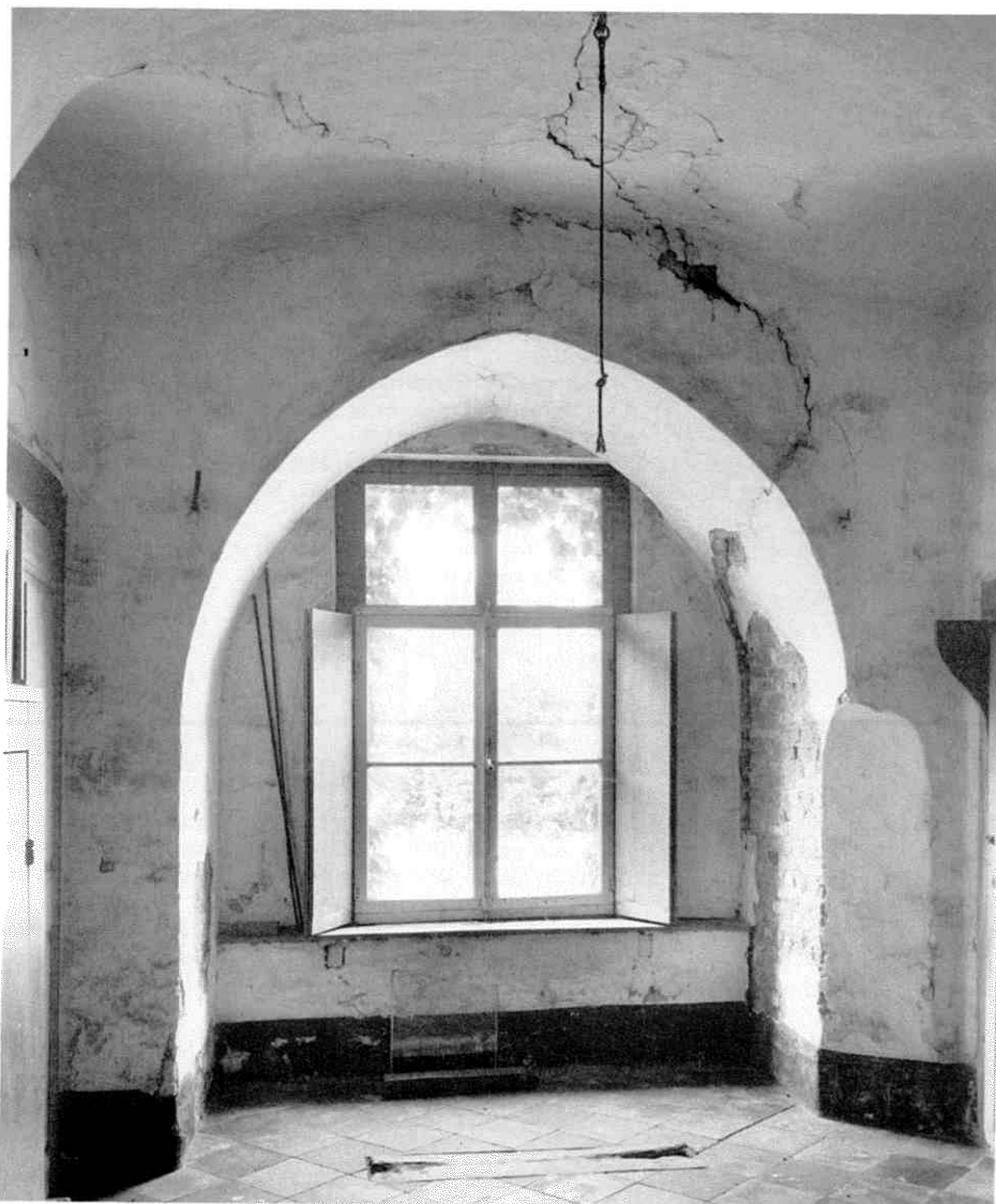
Afb. 8. Interieur foto, juli 1955.

1612, rond 1598 begonnen zijn met de herbouw van de Borch. Er is echter geen zinnig woord over te zeggen hoe lang hij met de herstelwerkzaamheden bezig is geweest. Immers, na twintig jaar diende hij allereerst de puinhopen te ruimen en hij ontkwam er zeker niet aan al het bouwvallige opgaande muurwerk te slopen. Alleen de gravure, die uit 1604 zou stammen, geeft een aanwijzing 42 . De tekening oogt eigenlijk te mooi om waar te zijn. Daarentegen biedt de schets uit de tijd van Syberts opvolger, vermoedelijk gemaakt tussen 1613 en 1637, een groot verschil 43 . De eerste tekening laat ons een robuuste vierkante toren zien, terwijl de tekenaar van de schets uit 1613-1637 een ronde toren laat zien. Men kan zich afvragen in hoeverre deze tekenaars eigenlijk te vertrouwen zijn. Sybert van Eyll en Ermgard van Bijlandt waren onder huwelijksvoorwaarden getrouwd, want na Syberts dood – hij overleed vóór 1613 – verkreeg zijn vrouw de gebruiksrechten van de Borch bevestigd 44 . Door