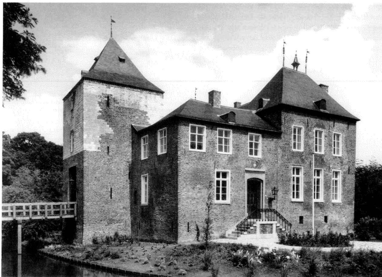
Afb. 1. De Borch Baarlo na de restauratie, 1974.

Bij nadering van het dorp Baarlo valt meteen het gemeentebord op. Het verwelkomt de bezoekers en vermeldt dat men zich in het kastelendorp bevindt. Naast de zogenaamde kastelen of versterkte huizen staan er slechts twee riddermatige huizen. Het betreft de Borch en de Raay die beide de eigenaren destijds onder bepaalde condities toegang verleenden tot zitting in de Staten van het Overkwartier. De Borch wordt in de volksmond kasteel d'Erp genoemd naar een van de laatste adellijke bezitters, namelijk de familie Van Erp. De heerlijke rechten van het dorp Baarlo waren, ondanks deze prachtig klinkende namen, vóór 1673 aan geen van deze kastelen verbonden.