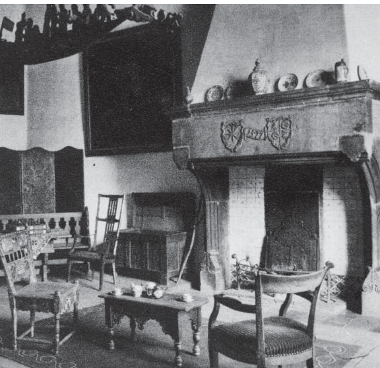
Afb. 7. Een van de schouwen in de Cannenburch te Vaassen toont de datum 1577.

het zicht – opnieuw in het poortgebouw invoegt. Meestal werden de stenen geplaatst daar waar ze goed te zien waren, in veel gevallen als eerste blikvangers op het poortgebouw. De bezoeker van het kasteel – alsook zij die geen toegang hadden en bij de poort halt moesten houden – werden gewezen op het eigenaarschap, meestal met verwijzingen naar (of legitimeringen van) een uitgebreide stamboom.