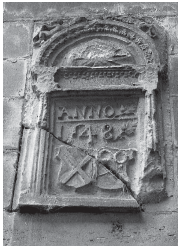
Afb. 5. Herplaatste gevelsteen van Het Geudje.

voor de Eusebiuskerk in Arnhem en signeerden deze: 'Gherardus de Wou et Gobellinus Moer me fecerunt – Gobelinus Moer et Gherardus de Wou me fecerunt' (Geert van Wou en Gobel Moer hebben mij gemaakt – Gobel Moer en Geert van Wou hebben mij gemaakt). 25 Andere ecclesiastische middeleeuwse (persoonlijke) verwijzingen waarnaar nog geen uitputtend onderzoek is verricht maar welke mogelijk interessante informatie zouden kunnen opleveren over datum- en naamstenen, betreffen stichtersportretten, familiealtaren en inscripties op kruisvaarderskastelen. Bezien vanuit deze ecclesiastische context is Schloss Sachsenburg in Duitsland, net over de grens met het huidige Nederland, interessant. In een slotkapel vermeldt een uitgebreide inscriptie zowel de eigenaar als de datum 1488. Tussen