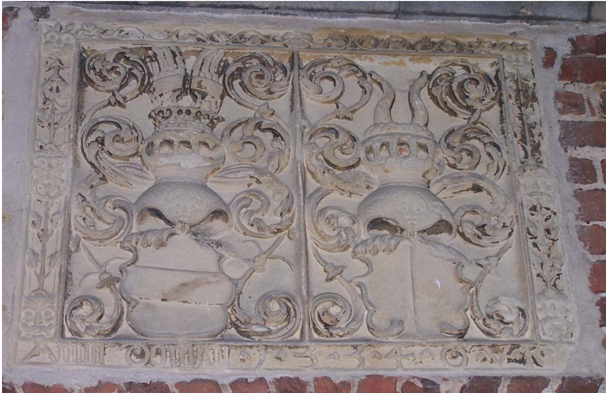
Afb. 3. Steen uit 1554 met de familiewapens van de families Van Raesvelt en Van Wullen.

alleen door middel van een symbool of icoon in de vorm van een datum (vanaf het midden van de 16e eeuw, wellicht onder invloed van de opkomst van jaarankers, soms zeer groot uitgevoerd), wapen, naam of initialen. 16 De scheidslijn lijkt ook wat betreft de schrijfwijze van de jaartallen ongeveer in het midden van de 16e eeuw te liggen: waar in de eerste helft van de eeuw nog voornamelijk gebruik werd gemaakt van Romeinse cijfers, werden in de tweede helft van de eeuw Arabische cijfers gangbaar.