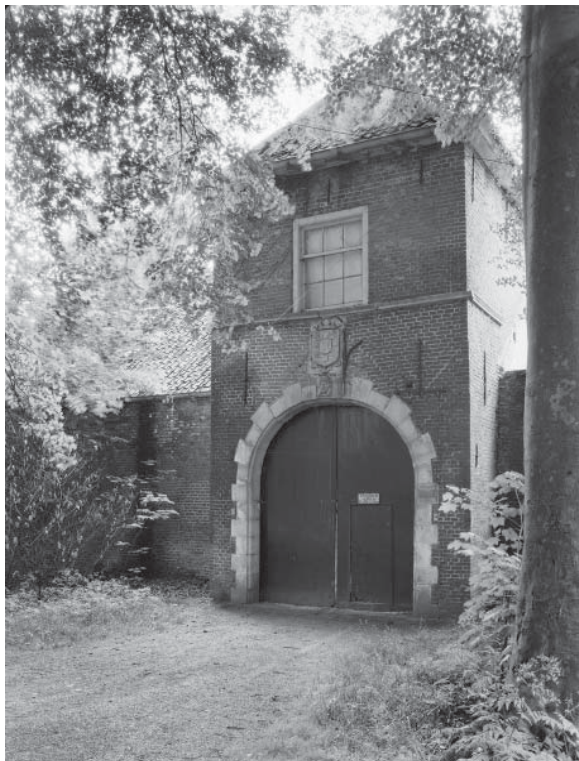
..... Afb. 1. Poortgebouw van Zuilenstein met gevelsteen.

vervanging van God door de ontwikkeling van de spiegel. 6